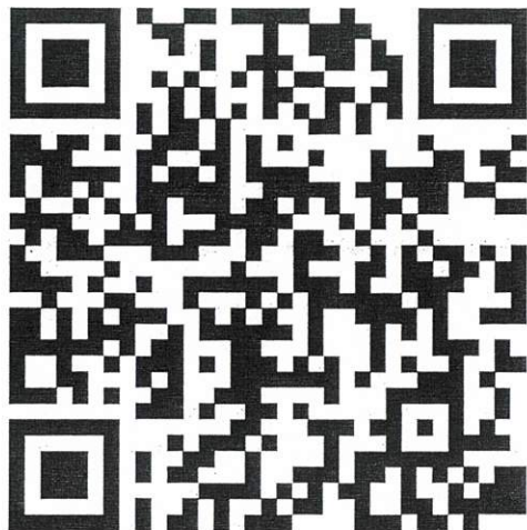
信服办 APP 下载二维码