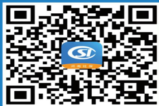
河南社保微信公众号