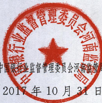
中国银行业监督管理委员会河南监管局