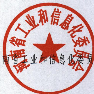
河南省工业和信息化委员会