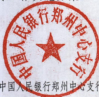
中国人民银行郑州中心支行