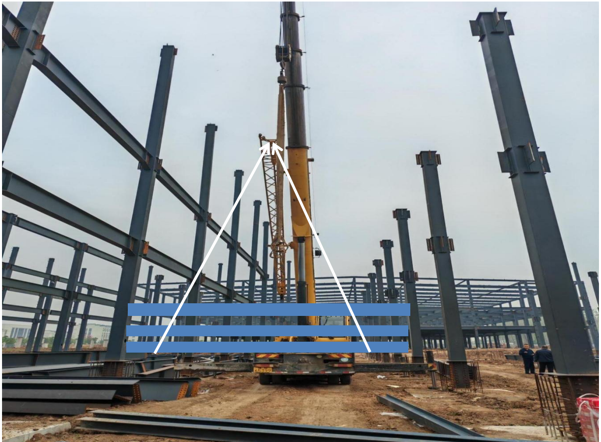
图2吊装工字钢构件示意图

事故发生后县领导、县应急局、县公安局、栏杆街道办主要负责人第一时间赶赴事故现场，组织救援及善后处置工作。淮滨县应急管理局在接到事故报告后，按照事故报告程序分别向县委、县政府和信阳市应急管理局上报事故信息，会同县住建局赶赴现场处置，事故应急处置和善后工作及时高效。