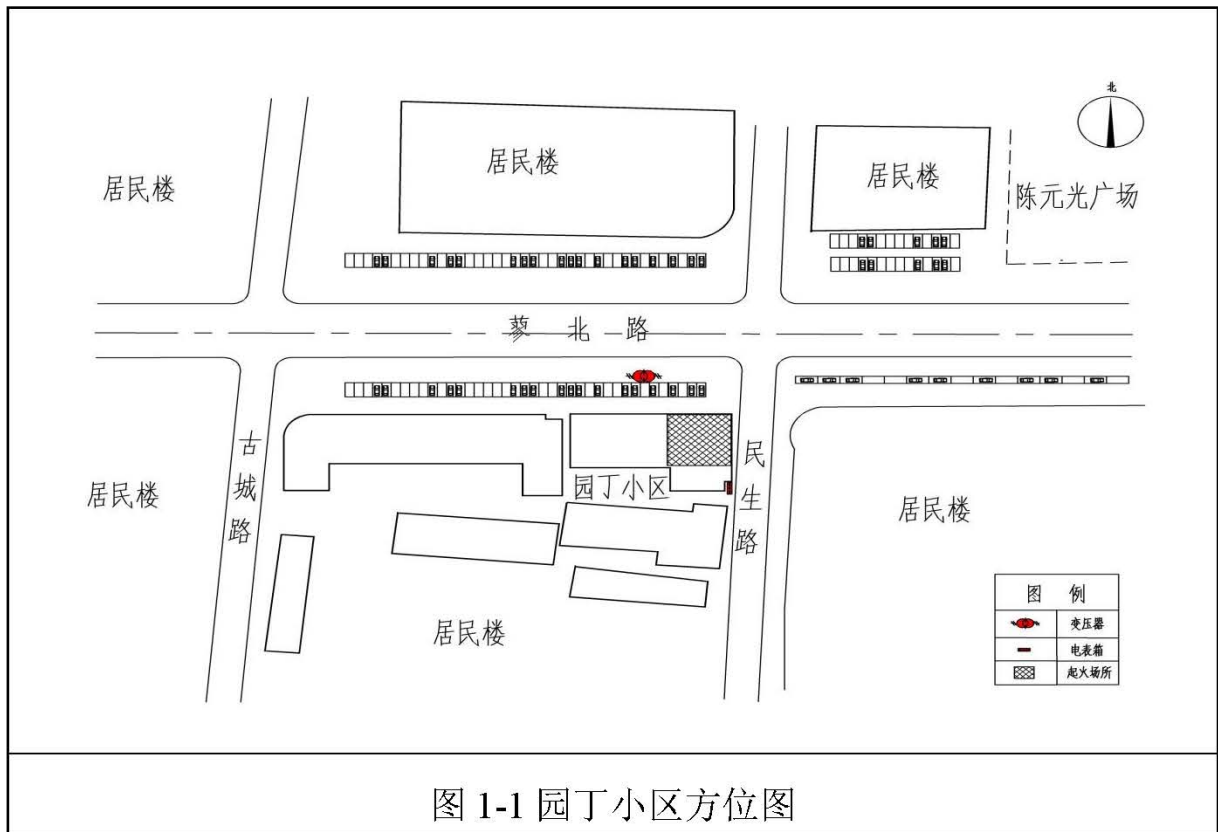
图 1-1 园丁小区方位图